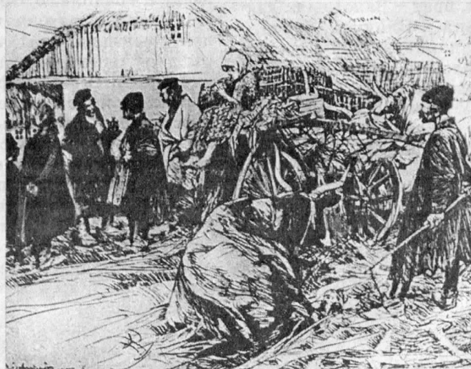
С. Богуш-Сестранцэвіч, «У мястэчку»

і інш. У Беларусі малюнак выкладаюць у Беларускай акадэміі мастацтваў, Віцебскім дзяржаўным універсітэце, Мінскім дзяржаўным мастацкім каледжы і інш.