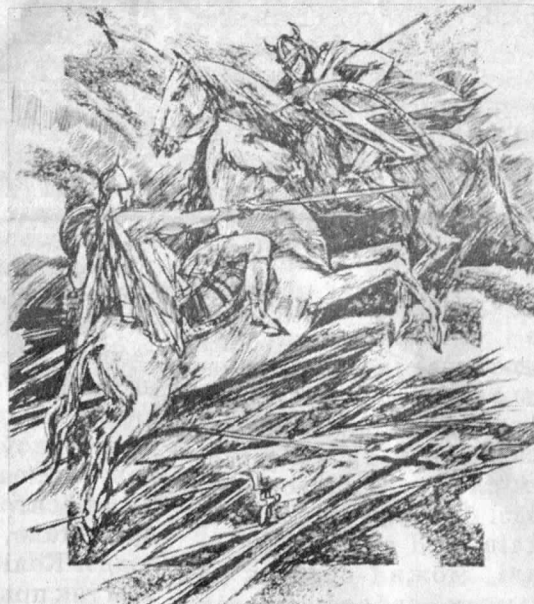
Малюнак А. Александровіча да кнігі В. Чаропкі «Імя ў летапісе»

Шмат працавалі ў гэтай галіне Я. Дамель, І. Аляшкевіч, Г. Вейсенгоф, В. Ваньковіч, Н. Сілівановіч, С. Богуш-Сестранцэвіч, Ф. Рушчыц (XIX – пач. XX стст.). У 1920–1930-я гг. ў галіне станковага малюнка працавалі Я. Драздовіч, А. Астаповіч, М. Аксельрод, М. Філіповіч, П. Сергіевіч, М. Тарасікаў, А. Тычына і інш. У 1940–1980-х гг. сярод майстроў В. і А. Волкавы, С. Раманаў, А. Паслядовіч, М. Гуціёў, А. Кашкурэвіч, В. Шаранговіч, С. Герус, У. Сакалоў, І. Ушакоў, П. Любамудраў, Г. Паплаўскі, Я. Жылін, М. Блішч, М. Карпук, Я. Кулік, У. Басалыга, У. Савіч, У. Гардзеенка, М. Рагалевіч, М. Селяшчук, А. Пашкевіч, В. Дубрава, С. Гарачаў, В. Мікіта