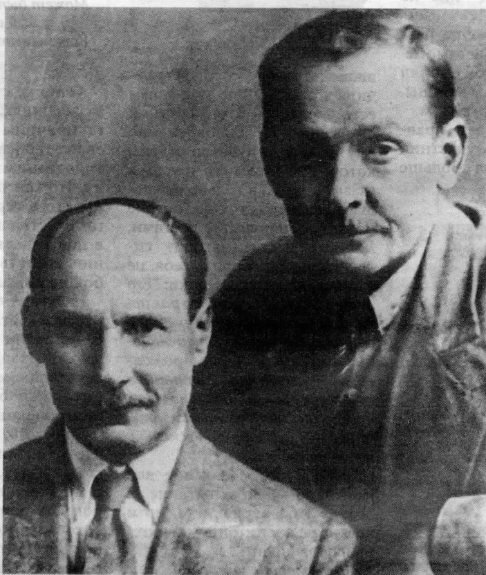
Якуб Колас і Янка Купала. 1935 г.

У гэтым жа святле ўспрымаўся і вобраз Якуба Коласа. Яго імя значылася ў спісе кандыдатаў у члены Устаноўчага сходу ад Беларускай сацыялістычнай грамады. Пазней пісьменнік заўважаў, што ён не даваў на гэта згоды. Можна дапусціць, што яго не задавальня-