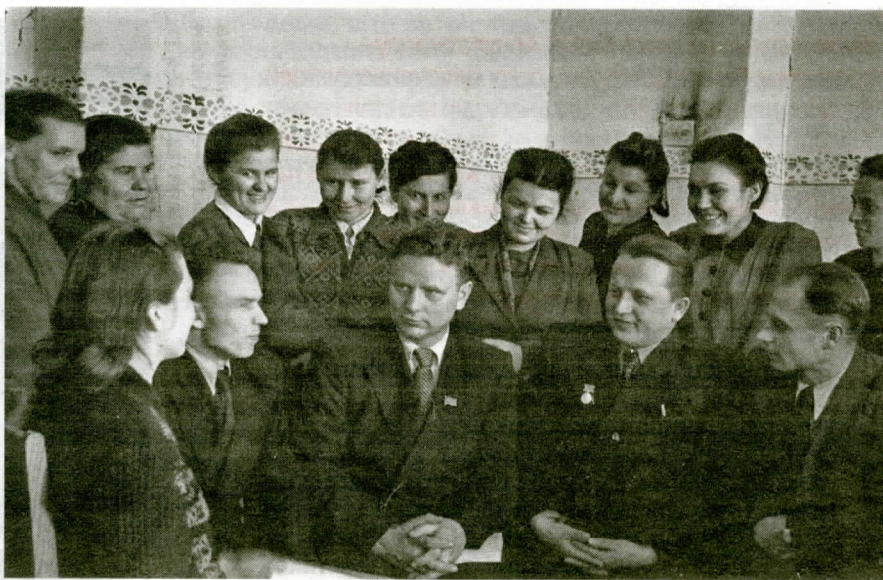
Максім Танк і Іван Шамякін на сустрэчы з настаўнікамі Пleshчаніцкай сярэдняй школы. 1952 г.