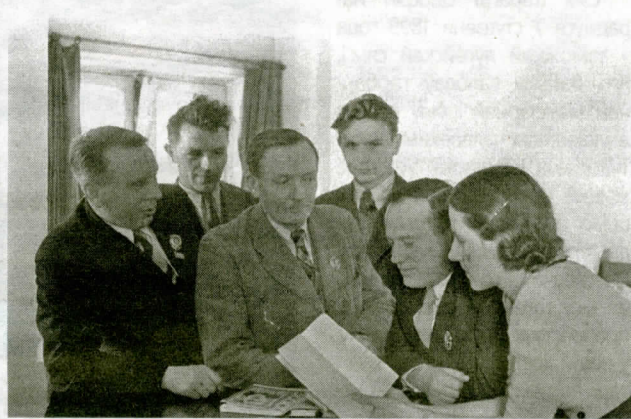
Злева направа: М.Лынькоў, М.Паслядовіч, Я.Купала, М.Танк, П.Броўка, Я.Бранеўская. 1939 г.

Гэтымі днямі наша краіна святкуе 100-годдзе з дня нараджэння народнага паэта Беларусі Максіма Танка. З дазенай нагоды ў сталіцы ды рэгіёнах праходзяць мерапрыемствы, прысвечаныя творцу і яго літаратурнай спадчыне.