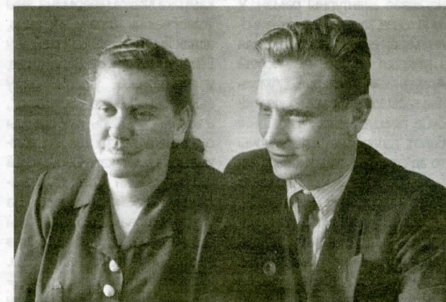
Максім Танк з жонкай. 1952 г.

Танка: вершы і паэмы, апавяданні, нарысы, фельетоны, нататкі, артыкулы, рэцэнзіі, выступленні, некралогі, "Лісткі календара" і дзённікі, пераклады, лісты. Упершыню ўвайшлі ў шматтомнік шматлікія архіўныя дакументы з фонду Максіма Танка ў Беларускім дзяржаўным архіве-музеі літаратуры і мастацтва і з архіваў Польшчы, Літвы, Расіі. Таксама ў Зборы твораў змешчаны лісты паэта, якія раней былі прадстаўлены толькі ў перыядычным друку.