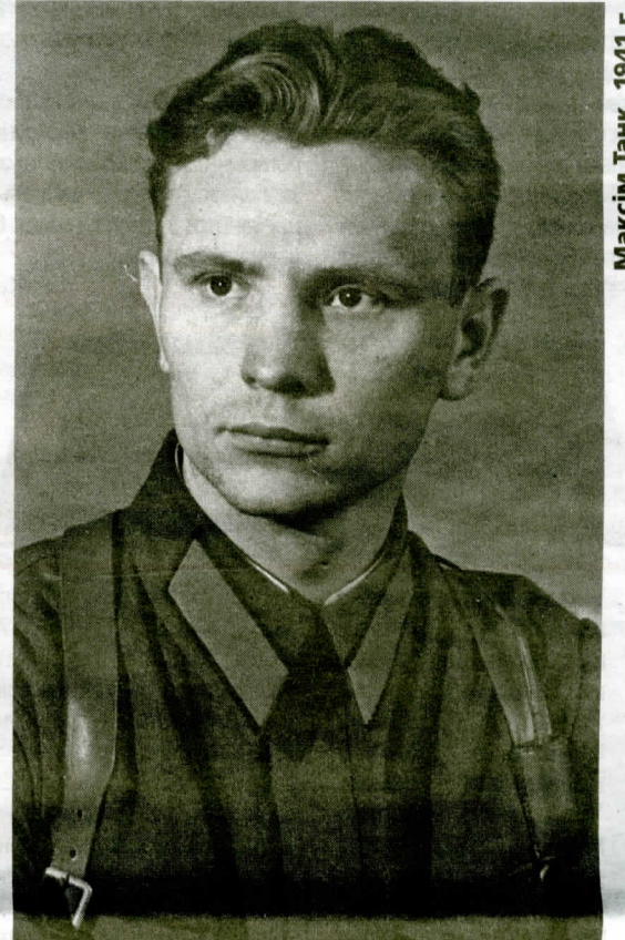
Максім Танк. 1941 г.

сэрцам пісаў сваю кожную песню...". прысвечанае 100-годдзю з дня нараджэння Максіма Танка, што арганізавана пры фінансавай падтрымцы Міністэрства культуры Рэспублікі Беларусь. Яно распачнецца ўскладаннем кветак да магілы паэта ў вёсцы Новікі. Пасля гэтага святочныя мерапрыемствы прадоўжацца ў Мядзелі цырымоніяй адкрыцця