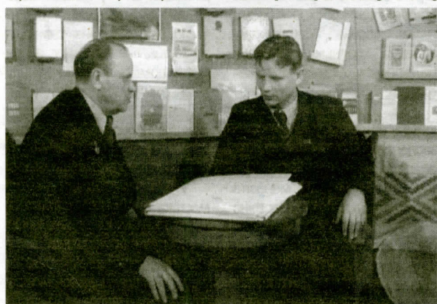
М.Танк (справа) і К.Крапіва ў дні Дэкады беларускай літаратуры ў Маскве.