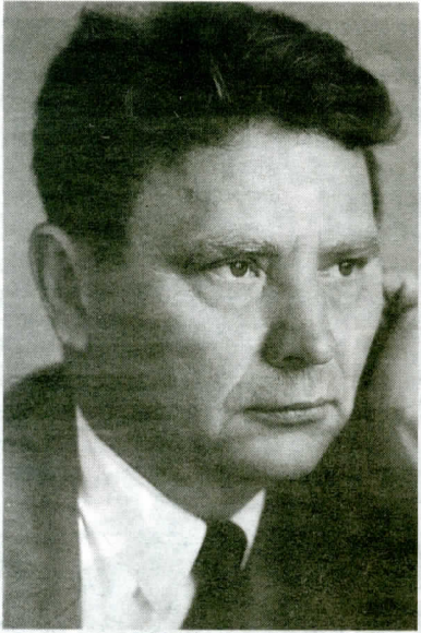
Максім Танк. 1962 г.