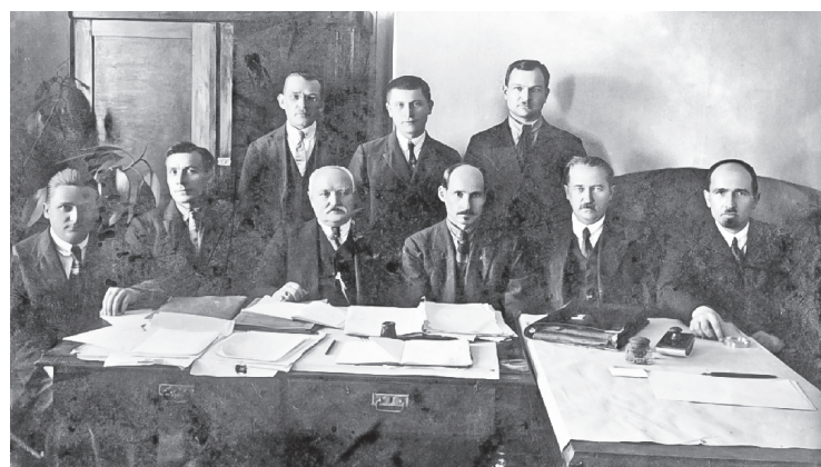
Якуб Колас з прадстаўнікамі навукова-тэрміналагічнай камісіі Інбелкульту. 1927 г.

Што ўдалося ажыццявіць у новым "Летапісе"? Так, у выданні 1982 года пераважна рабіўся акцэнт на стасункі Коласа з афіцыйнымі асобамі ў