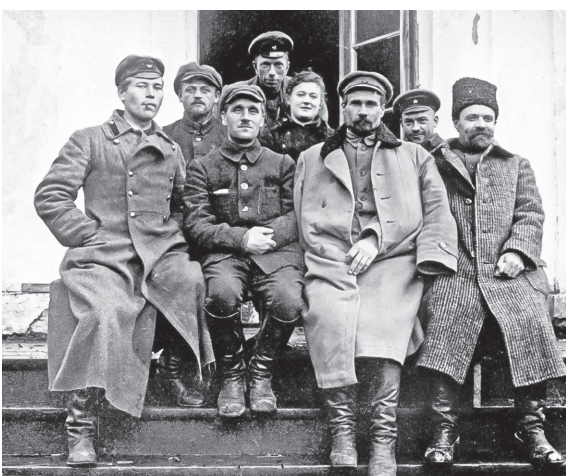
Якуб Колас і жыхары вёскі Сёмкава. 1922 г.

Як сведчыць аўтар, падчас працы ён імкнуўся ўзмацніць дакументальную аснову "Летапісу" і наблізіць яго да жанру навуковай біяграфіі. Пры спрыяльных абставінах апошняе можа стаць наступнай працай даследчыка. Такім чынам будзе выканана воля Коласа, які марыў напісаць праўдзівую аўтабіяграфію.