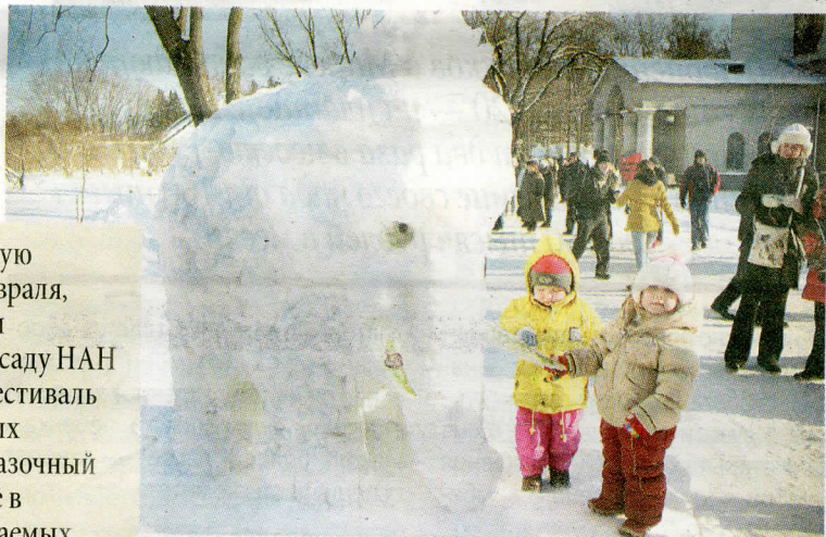
В минском ботаническом саду — ледниковый период, 2012 год

безопасности. Проводка совсем старая была.