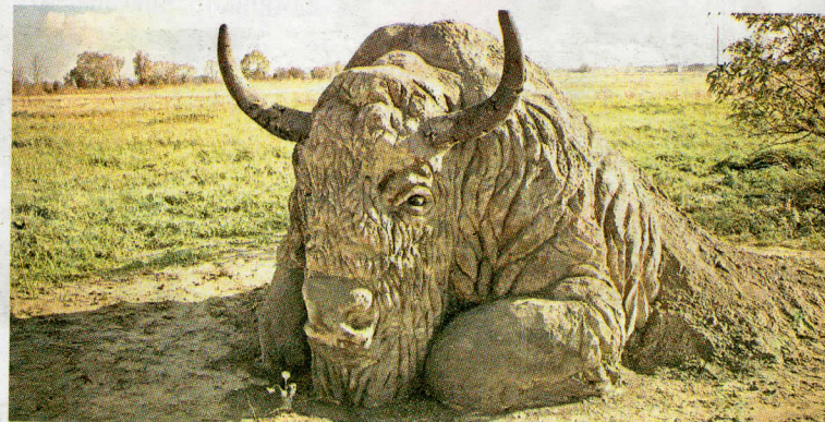
Да из него же песок сыплется! «Зубр», Калининград, 2012 год