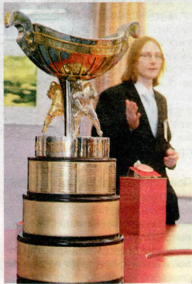
Новый экспонат (на временном хранении) — кубок Президента Беларуси, вручаемый команде — победителю Открытого чемпионата страны по хоккею с шайбой. После игр кубок отправляется в Гомель на завод-изготовитель, где на основание крепится очередная табличка с указанием победителя.

Чтобы попасть в Музей государственности (ул. К. Маркса, 38, подъезд № 4), нужно за пять дней до планируемой экскурсии прийти в Национальный исторический музей Республики Беларусь (ул. К. Маркса, 12) и подать заявку. Коллектив предприятия может прислать ее по факсу. В заявке указываются паспортные данные посетителя — 20 тысяч рублей (студентам и школьникам — вдвое дешевле). Экскурсионное обслуживание — 35 тысяч рублей.