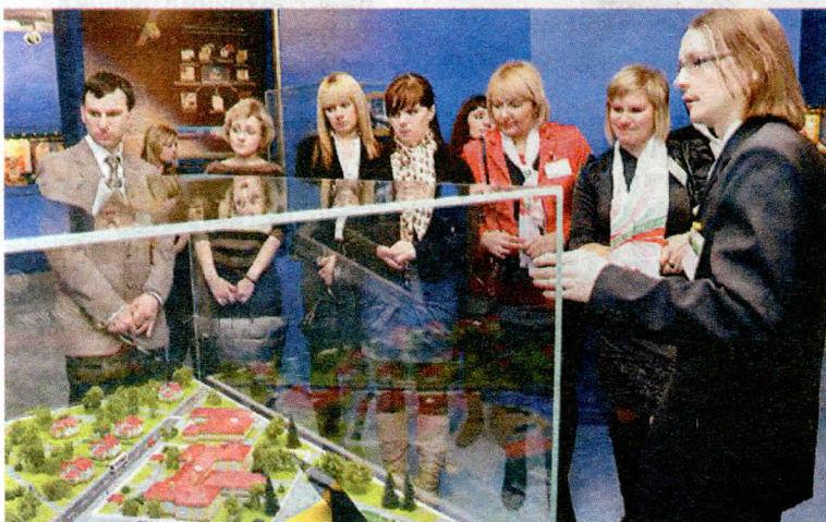
У макета агрогородка — качественно нового типа сельского поселка