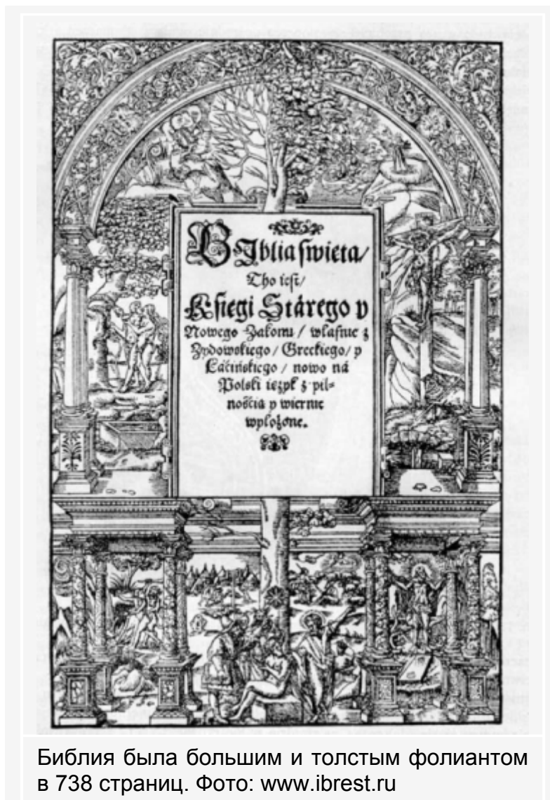
Библия была большим и толстым фолиантом в 738 страниц.

Один из экземпляров меценат презентовал польскому королю Жигимонту Августу. Остальные разослал в реформистские сборы, раздарил друзьям и так далее.