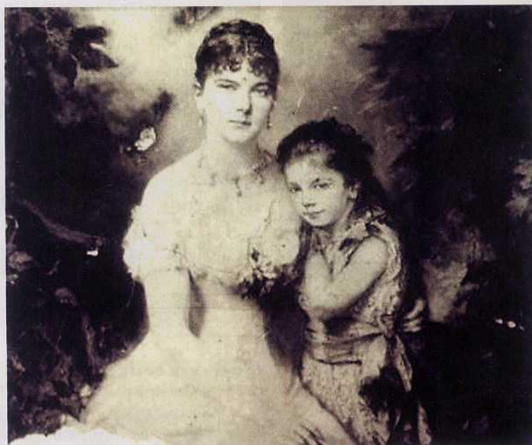
Магдалена Радзівіл з дачкой. З карціны невядомага мастака

Асноўная частка кнігі — гэта матэрыялы “круглага стала”, прысвечанага 150-м угодкам княгіні, арганізатарамі якога выступілі Міжнародная асацыяцыя беларусістаў і Цэнтральная навуковая бібліятэка імя Якуба Коласа Нацыянальнай акадэміі навук Беларусі. Нагадаю, пад час правядзення ўрачыстасці акадэмік-сакратар АДДЗлення гуманітарных навук і мастацтваў доктар гістарычных навук Аляксандр Каваленя звярнуў увагу на важнасць і прыярытэтнасць такога кірунку працы, як вяртанне забытых імёнаў дзяўчаў беларускай культуры. Старшыня Камітэта Міжнароднай асацыяцыі беларусістаў, пра Магдалену гаварылі на Уздзеншчыне