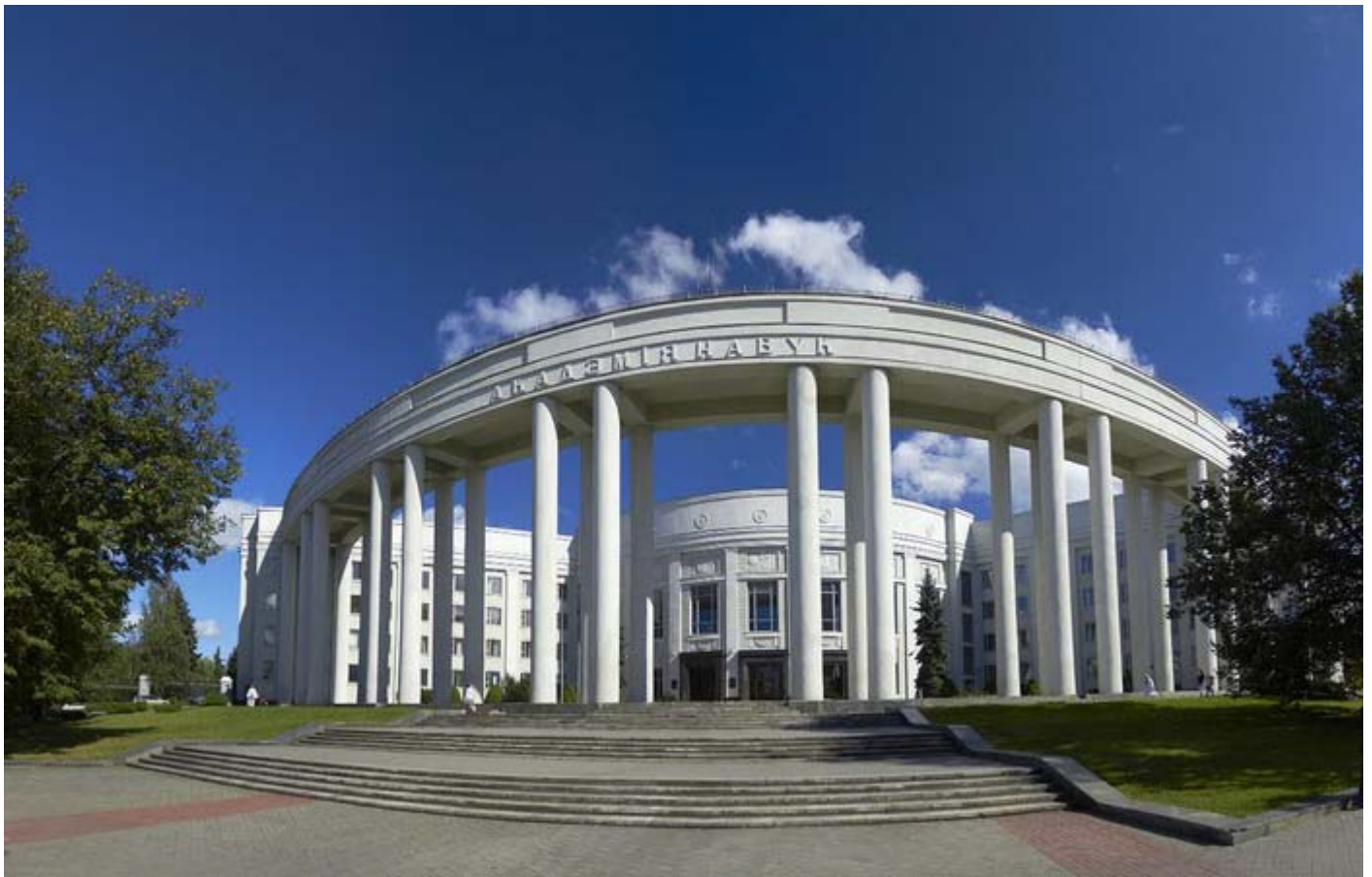
Академия наук Республики Беларусь