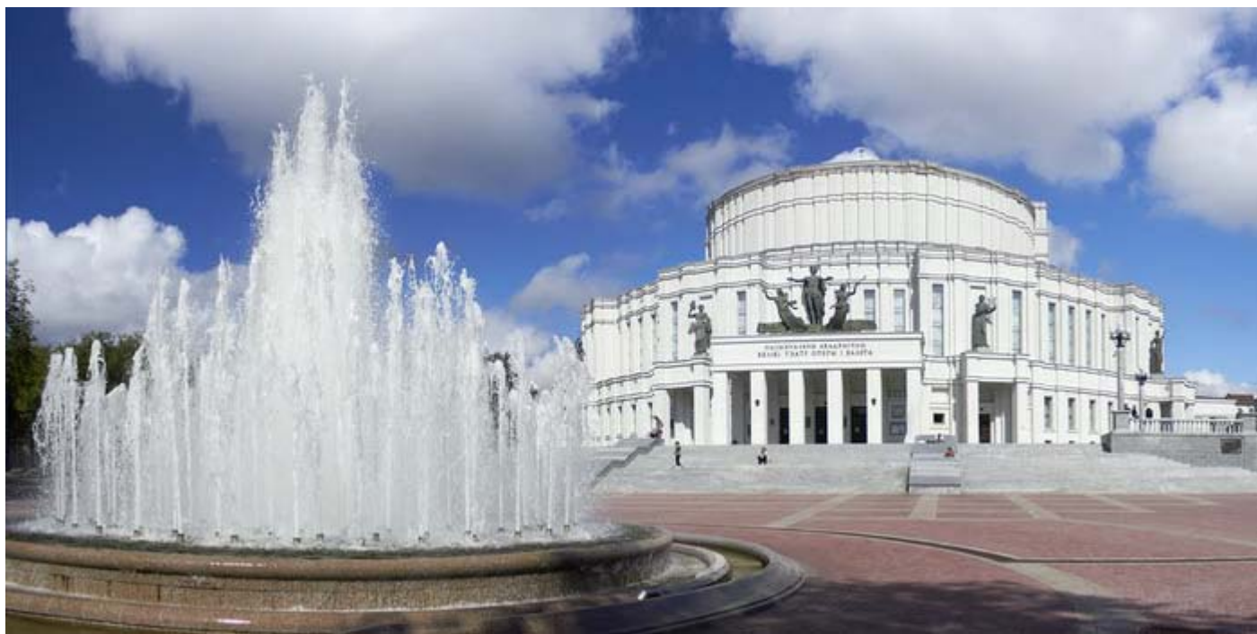
Национальный академический Большой театр оперы и балета Республики Беларусь