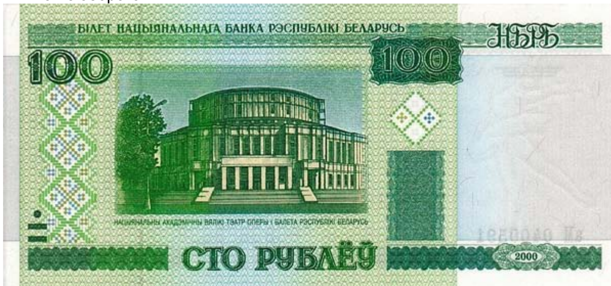
Сторублевая банкнота с изображением Национального академического Большого театра оперы и балета