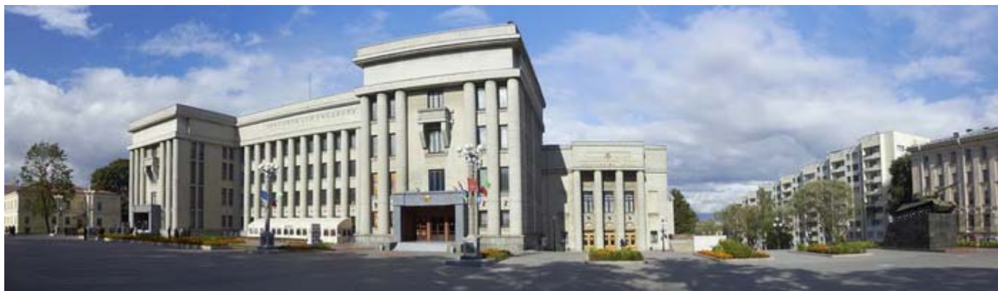
Дом офицеров Вооруженных Сил Республики Беларусь

Со схожим энтузиазмом возводили белорусы и спроектированные Иосифом Григорьевичем роскошный театр оперы и балета (1933-1937 г.), строгий Дом Красной Армии – ныне Дом офицеров Вооруженных Сил Республики Беларусь (1934-1939 г.).