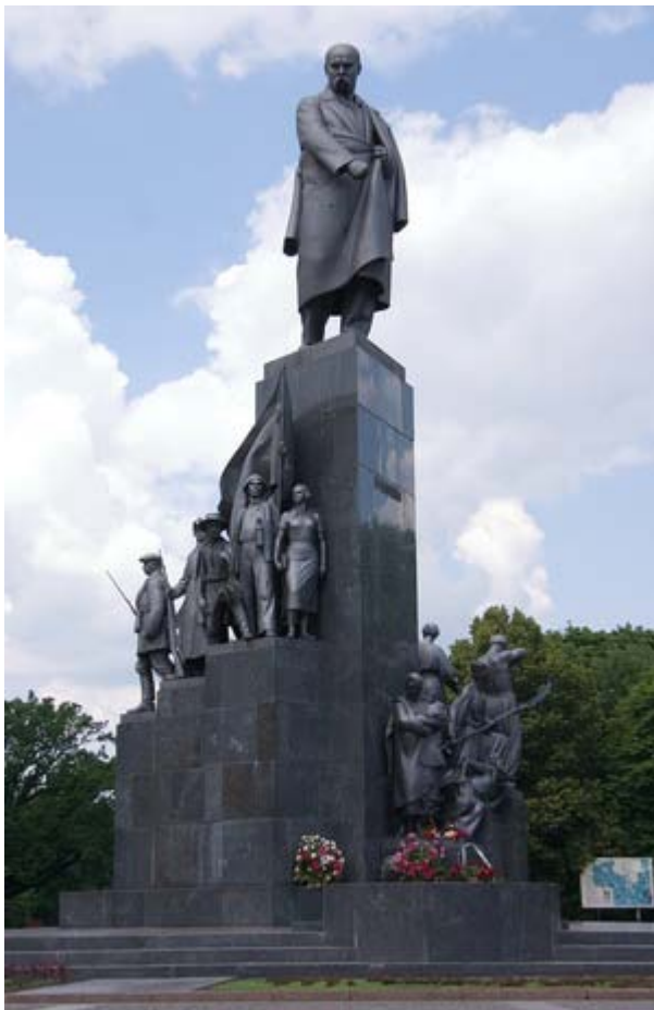
Памятник Тарасу Шевченко в Харькове