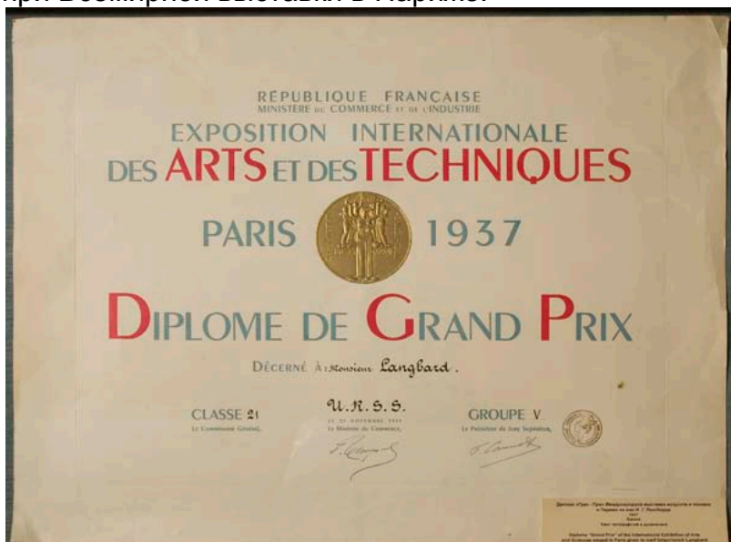
Диплом Гран-при Всемирной выставки искусств в Париже на имя Лангбарда

Подобно создателю, выстояли в войне и его монументальные строения. В Доме правительства оккупанты разместили штабы эсэсовцев, гестапо и базу снабжения войск, в театре оперы и балета устроили конюшню. В Доме Красной Армии работал Soldaten Heim («Солдатский клуб») с рестораном, кинотеатром и... домом терпимости. После освобождения Минска, минеры обнаружили под зданиями тысячи килограммов взрывчатки. Почему гитлеровцы не привели ее в действие? После войны минчане любили повторять, что своим творчеством архитектор настолько угодил Всевышнему, что тот не позволил разрушить его творения. В 1937 году за архитектуру Белоруссии Лангбард получил Гран-при Всемирной выставки в Париже.