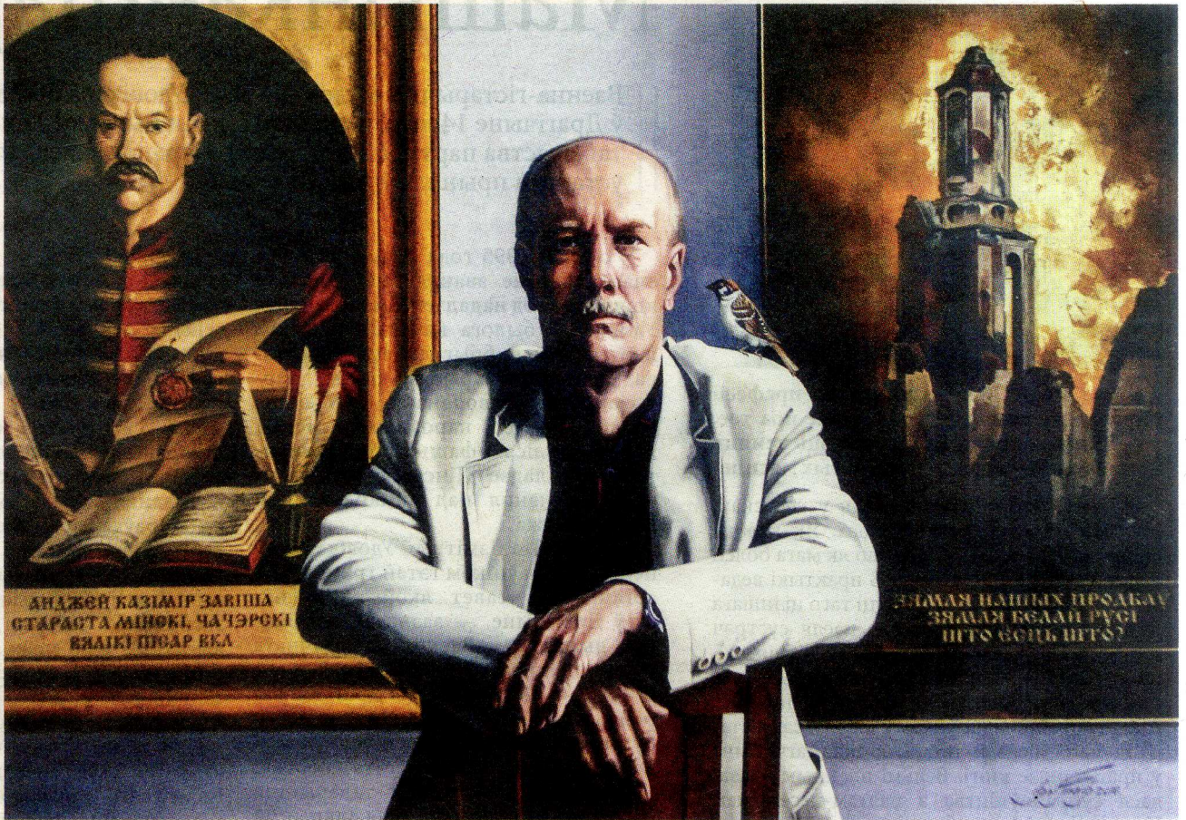
Аўтапартрэт. 2010 г.