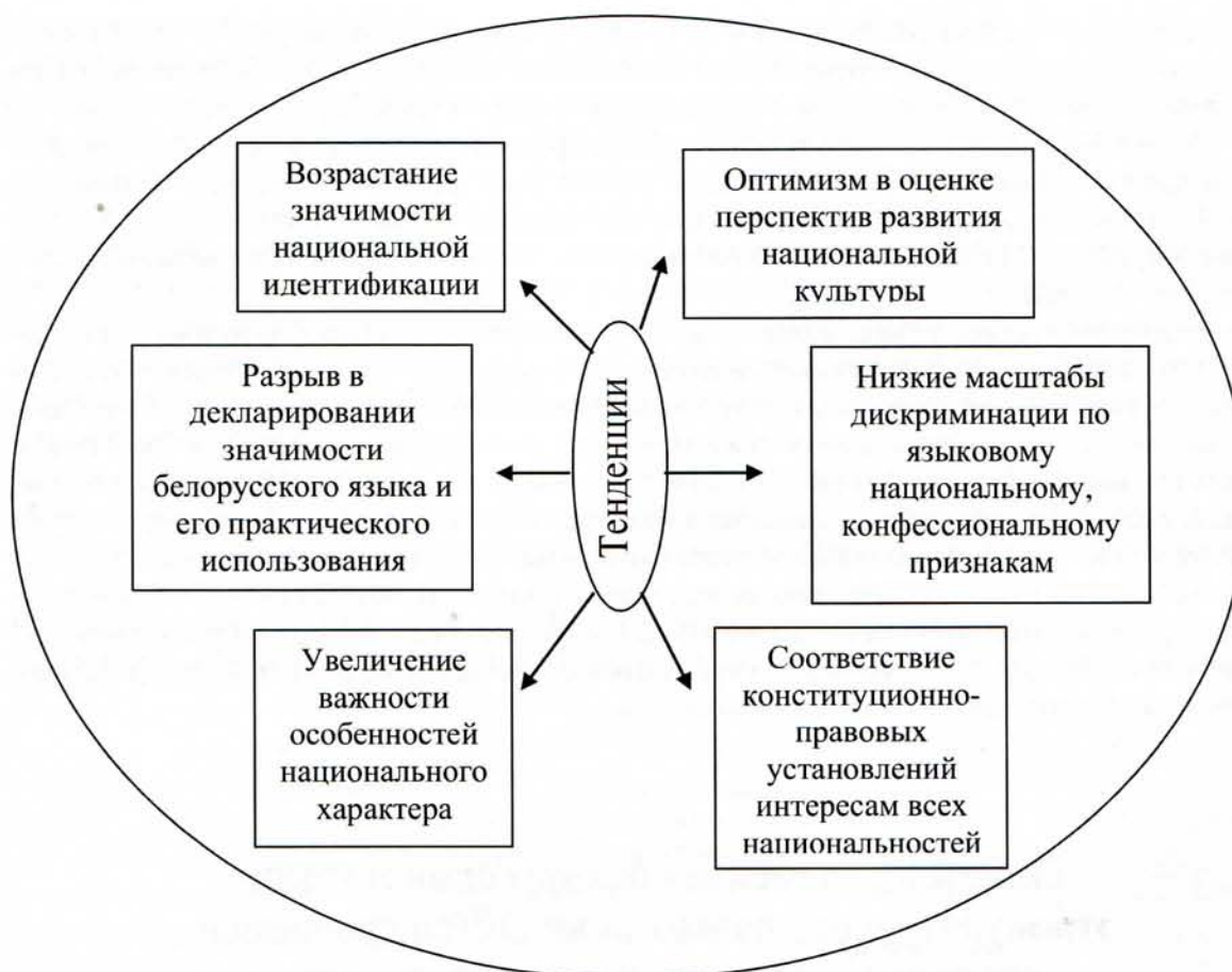
Схема 2. Тенденции в развитии этнонациональных процессов