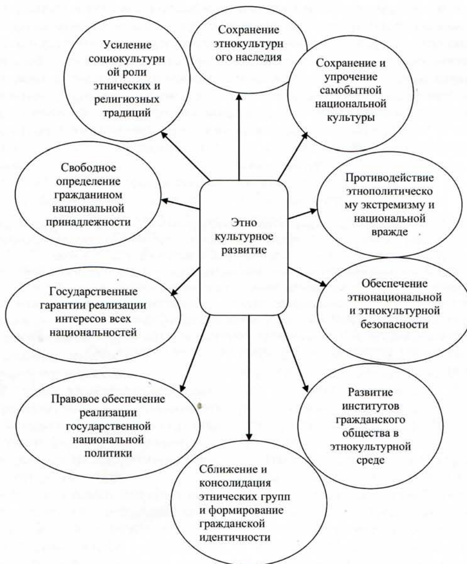
Схема 3. Структурная архитектура белорусской модели этнокультурного развития

Возрастающая значимость этого направления деятельности предопределяется тем, что информационное пространство Беларуси вследствие ее транзитивного положения