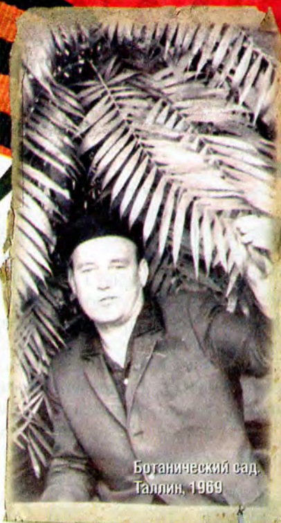
Ботанический сад. Галлия, 1969

В хате вместо светильника использовали гильзы. Туда заливали керосин, опускали фитиль и поджигали. Получалась керосиновая лампа. Единственной игрушкой за все детство у меня была деревянная палочка, которая обвязывалась веревкой. Когда дергаешь за концы веревки, палочка крутится и жужжит. Вот такое детское счастье.