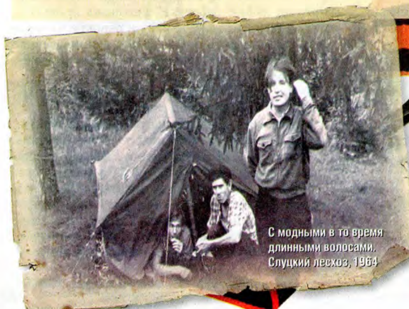
С модными в то время длинными волосами. Слуцкий лесхоз, 1964

В 1944-м мы знали, что войска Красной армии рядом. Возле Горок, где проходила линия фронта, в ясную погоду виднелся веер из трансирующих пуль. Вскоре немцы отступили. Началась обычная жизнь. В сентябре я наконец пошел в 6-й класс – на время войны в деревне школа была закрыта.