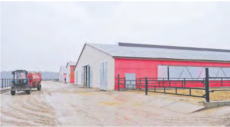
Средний удой на корову в молочнотоварном комплексе «Телешевичи» составляет 15,5 литра в сутки

Главное их достижение в этом отношении – строительство двух больших современных молочно-товарных комплексов с доильными залами. Первым из них шел МТК «Попки». Интересно, что специалисты «Маяка» обнаружили в типовом проекте большое количество таких мест, где получалось сделать и удобнее, и значительно дешевле. Конструкцию ключечник заменили на балочник, коров поставили на возвышение, чтобы уйти от неудобной ямы, плитку в коровнике положили не до половины стены, а до потолка, что дает возможность