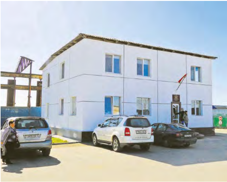
Административное здание ОАО «Маяк-78» стало значительно просторнее и комфортнее благодаря сооруженной не так давно пристройке

Экономия – уже сегодня видно – получится не только благодаря оптимизации проектного решения. Очень серьезно снизило затраты собственное производство пластиковых окон и дверей, открытое в «Маяке» несколько лет назад. Большую выгоду обещает и собственное производство межкомнатных дверей из древесноволокнистых плит, которое они намерены запустить в апреле, ведь только для завершения строительной программы-2017 «Маяку» необходимо порядка ста межкомнатных дверей, себестоимость которых получается лишь около 15 долларов (в эквиваленте), если делать их самим, а не 40 долларов, как у оптовиков. Вносит немалый вклад в минимизацию расходов собственная пилорама.