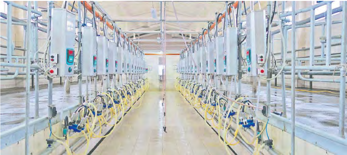
Доильный зал МТК «Телешевичи» – современный, оборудованный всем необходимым