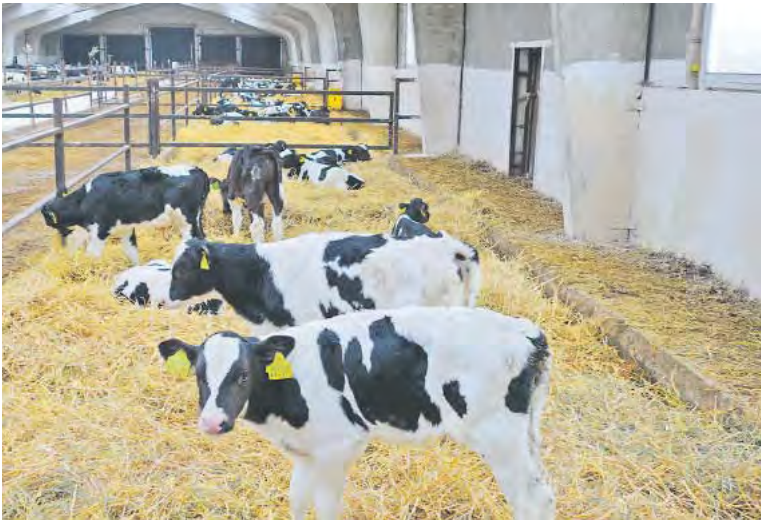
У телят всегда достаточный слой соломы: им должно быть тепло