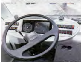
▼ Электробус Vitovt был представлен на международной специализированной выставке «ЭКПО-2017» в столице Казахстана Астане