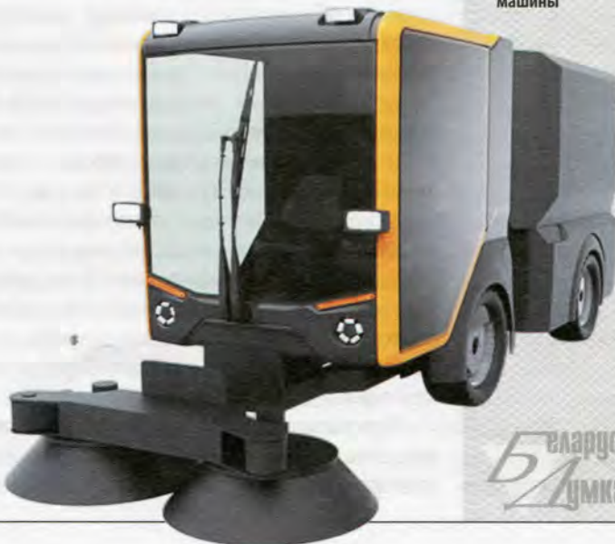
▼ Макет малогабаритной коммунальной машины

Что касается непосредственно развития проектов по созданию «зеленого» транспорта, такую программу важно синхронизировать с вводом в эксплуатацию БелАЭС. По словам А. Крепака, город сам может ввести преференции для развития экологически чистых таксопарка и парка электробусов, создать сеть зарядных станций. Это позволит сократить в столице суммарные выбросы вредных веществ автомобильных транспортных средств,