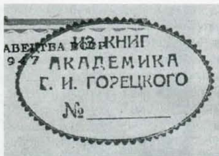
Штамп бібліятэкі Г.І. Гарэцкага.

1958): «Гаўрылу Іванавічу Гарэцкаму са шчырым пачуццём і самымі найлепшымі пажаданнямі. Станіслаў Шушкевіч. 20.XII.1959», на кнізе «Сарочы керамоў» (Мінск, 1959): «Гаўрылу Іванавічу на добры ўспамін. Станіслаў Шушкевіч. 20.XII.1959», на кнізе «Мы на змену ідзем» (Мінск, 1961): «Гаўрыла Іванавіч! Буду сардэчна рад, калі знойдзеце ў гэтай кніжцы цікавае для Вашых унукаў. Станіслаў Шушкевіч. 28.XII.1961».