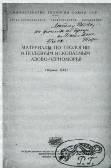
Дарчы надпіс Г. І. Гарэцкага сыну Радзіму Гарэцкаму.