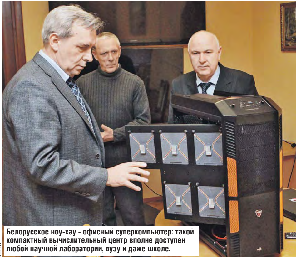
Белорусское ноу-хау - офисный суперкомпьютер: такой компактный вычислительный центр вполне доступен любой научной лаборатории, вузу и даже школе.

Продолжает работу и программа, рассчитанная до 2020 года, - «Совершенствование объектов военной инфраструктуры, планируемых к совместному использованию в интересах обеспечения региональной группировки войск Беларуси и России». Группировка работает уже семнадцать лет. В нее входят Вооруженные силы РБ и части Западного военного округа РФ. То, что эта группировка сформировалась, стало катализатором для интеграции в военной сфере стран ОДКБ и СНГ.