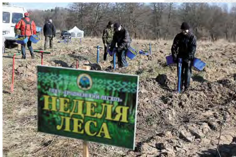
▲ Посадка леса в окрестностях Августовского канала. 2019 год

В апреле 2015 года между белорусским правительством в лице Министерства лесного хозяйства и Международным банком реконструкции и развития подписано соглашение о займе к проекту «Развитие лесного сектора Республики Беларусь» на сумму 40,714 млн долларов. Полученные средства были вложены в строительство современных лесосеменных центров по выращиванию посадочного материала с закрытой корневой системой, закупку необходимой техники и оборудования. Проанализировав ход выполнения проекта, в марте 2018 года Совет исполнительных директоров Всемирного банка принял решение о выделении Беларуси дополнительного финансирования в размере 12 млн евро. Деньги будут направлены на строительство лесосеменного центра на Могилевщине, модернизацию лесозаготовительной техники, совершенствование охраны лесного фонда.