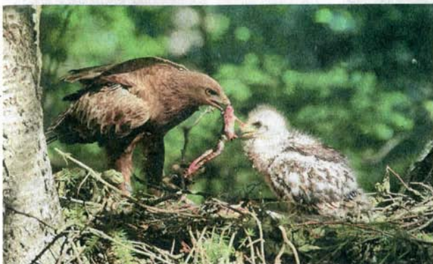
Малый подорлик поймал лягушку для своего птенца.

22 мая, начиная с 2001 года, во всем мире отмечают Международный день биологического разнообразия. В Беларуси к этому событию приурочена Неделя родной природы, которая проходит в Национальной академии наук с 22-го по 29 мая.