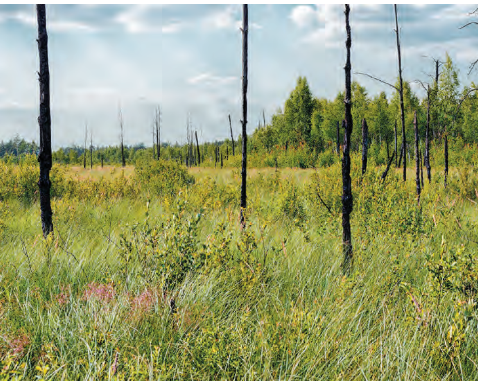
Вид болота в заказнике "Ольманские болота" спустя несколько лет после пожара.