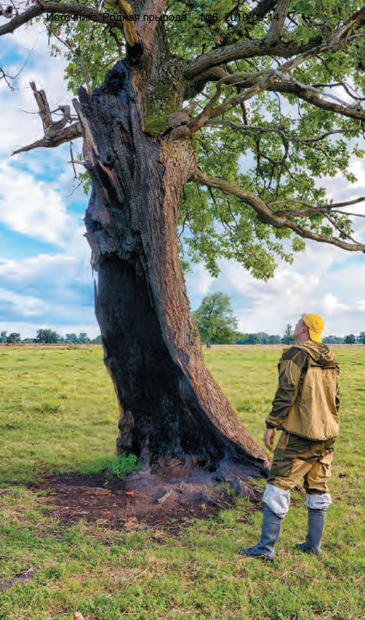
Поджоги живых дуплистых деревьев.