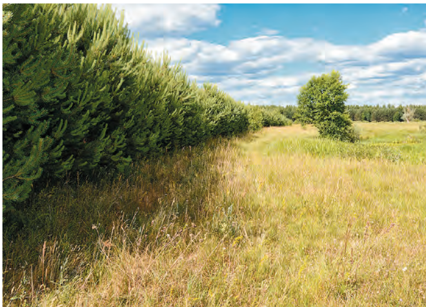
Лесопосадки отвоевывают пространство у лугов.

Но территория нашей страны расположена в лесной зоне, где лугам отведена второстепенная роль. Коренные луга в Беларуси раскинулись только там, где деревья не находят подходящих условий для существования, — в поймах рек. Поэтому обкашивание полей, окраин лесов, балок с крутыми склонами, выпас животных в таких местах в течение многих столетий освобождали земли