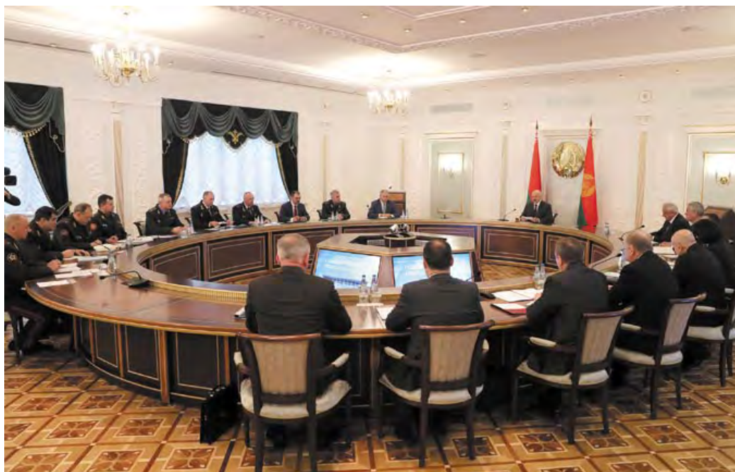
◀ На заседании Совета Безопасности Республики Беларусь. 12 марта 2019 года

Беларуси. Учебные материалы по истории в системе образования базируются на научных достижениях и подходах ученых НАН Беларуси. В стране постоянно проводятся научные исследования исторических процессов.