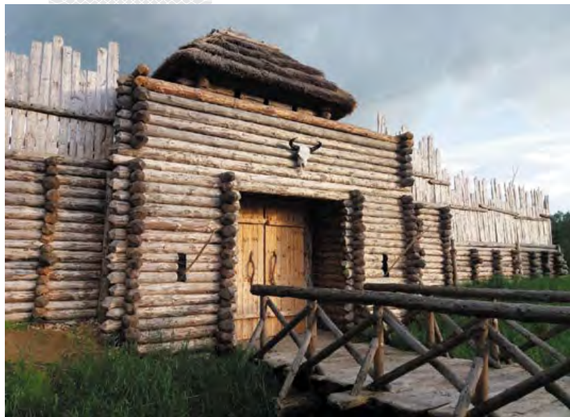
▲ Археалагічны музей пад адкрытым небам у Нацыянальным парку «Белавежская пушча»

богатайшыя гісторыка-культурныя і духоўныя традыцыі беларускага народа.