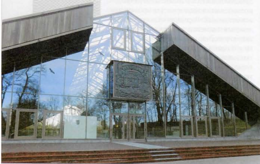
▼ Будынак філіяла Бярэсцкага абласнога краязнаўчага музея «Археалагічны музей «Бярэсце»

Менавіта гэтая акалічнасць і спарэдзіла ў навуковых колах меркаванне, што пры выкананні земляных работ у час будаўніцтва Брэсцкай крэпасці ўся мінуўшчына старажытнага Бярэсця была беззваротна страчана. Аднак так думалі не ўсе. У нешматлікай катэгорыі «сумнявальнікаў» быў і малады беларускі археолаг Пётр Лысенка, які настойліва шукаў сляды знікллага горада. У 1961 годзе ён прыехаў у Брэст разам з навуковым кіраўніком сваёй кандыдацкай дысертацыі маскоўскім археолагам Валянцінам Сядовым. Іх сумесная спр