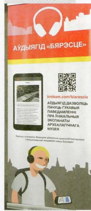
▼ Стэнд падключэння аўдыягіда для віртуальнага знаёмства з экспазіцыяй музея

– Наш музей вашы калегі-журналісты неаднойчы параўноўвалі з машынай часу, – гаворыць старшы навуковы супрацоўнік археалагічнага музея «Бярэсце» Аляксандр Карэцкі. – На двары – 2020 год, а зайшоўшы ў павільён, нібыта пераносішся ў XIII стагоддзе. Тут выразна адчуваюцца як бы два вымярэнні. сённяшні, рэальны час з яго падзеямі ды