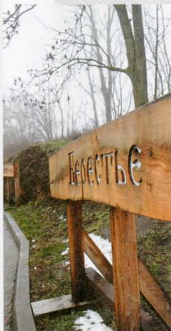
▲ Інсталцыя з назвай горада

Барыса Рыбакова. Задума стварэння на аснове раскопак Бярэсця археалагічнага музея ўсім спадабалася. А пасля таго як станоўча выказаўся наконт прапановы музейфікаваць раскоп старажытнага Бярэсця першы сакратар ЦК КПБ Пётр Машэраў, на ўсіх узроўнях справе было дадзена зялёнае святло. У студзені 1972 года Савет Міністраў БССР прыняў пастанову аб стварэнні ў Брэсце археалагічнага музея «Бярэсце».