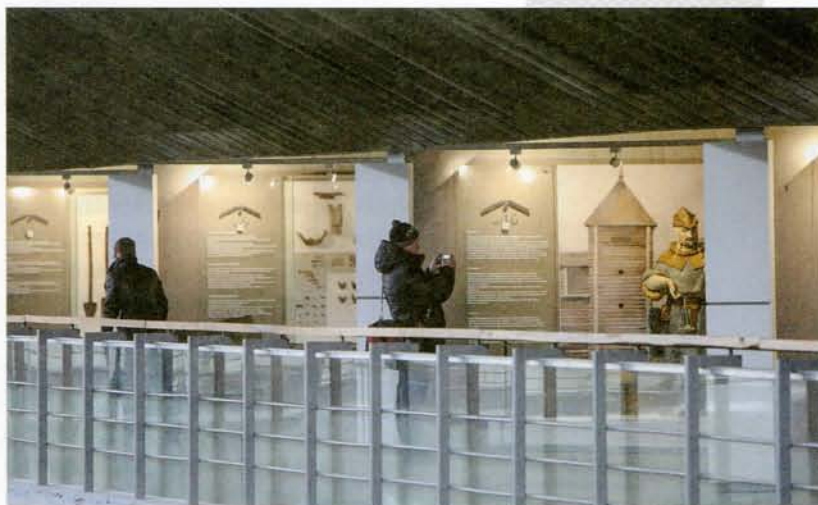
▲ Частка экспазіцыі, прысвечанай старадаўняму Бярэсцю

Аднак не ўсё гладка складвалася і пасля касыгінскай падтрымкі. Так, паранейшаму раз-пораз паўставалі пытанні фінансавага плана, зрываліся тэрміны ўзвядзення асобных аб’ектаў будучага музея, з-за перыядычнага павышэння ўзроўню грунтовай вады ўзніклі праблемы і ў раскопе. Была нават так званая «памідорная вайна»: у прыгранічнай зоне на тэрыторыі Валынскага ўмацавання Брэсцкай крэпасці жонкі ваеннаслужачых афіцэрскага складу ўраблялі агорды, праз якія ў разгар сезона давялося пракладваць камунікацыі і ўладкоўваць шляхі пад’езду тэхнікі да музейнай будоўлі. Гэта выклікала незадавальненне «дачніц», і яны ўсяляк спрабавалі прычыць правядзенню работ – пачынаючы ад скаргаў на археолагаў і будаўнікоў у высокія інстанцыі і заканчваючы скрытым шкодніцтвам. У рэшце рэшт усе гэтыя нягоды былі пераадолены – восенню