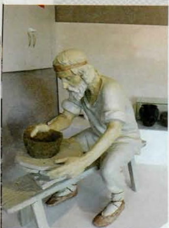
Нялёгкай, але вельмі запатрабаванай была праца берасцейскіх рамеснікаў-ганчароў

клопатамі, і мінулы, у якім жыццё даўно спынілася і ўсё, што павінна было адбыцца, ужо адбылося.