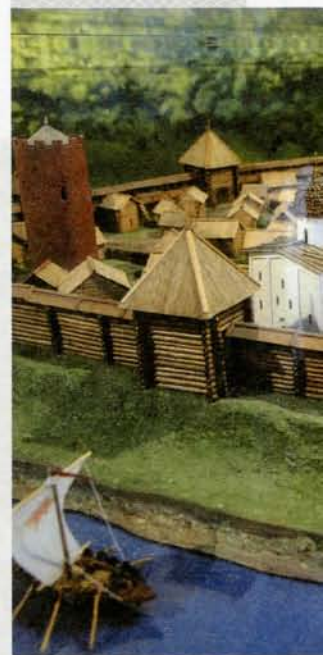
▼ Частка макета рэканструкцыі Бярэсця XIII стагоддзя