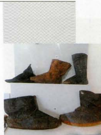
Абутак жыхароў старадаўняга Бярэсця