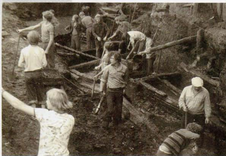
▼ У час раскопак. Архіўнае фота

Звычайна ступень непашкоджанасці пабудоў пры раскопках усходнеславянскіх гарадоў, культурны пласт якіх змяшчае арганічныя рэчывы, – два-тры вянцы, радзей чатыры-пяць. А тут – аж цэлых дванаццаць. Больш таго, пабудова захавала ў поўным выглядзе дзвярны праём і невялікіх памераў вентыляцыйныя вокны для выхаду пячнага дыму. Сцены яе былі пранумараваны насечкамі ад ніжняга да верхняга бярвяна. Відаць, будыніну ўзводзілі ў іншым месцы, разбіралі і пераносілі затым у горад.