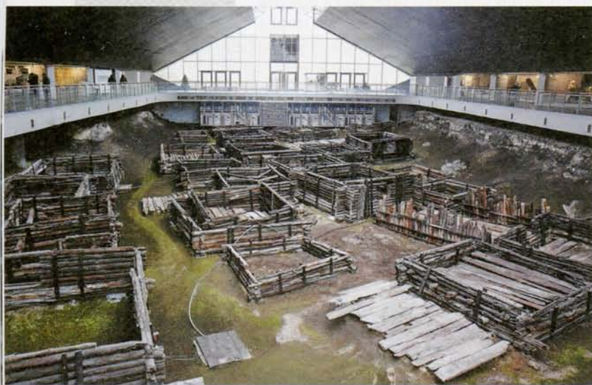
▼ Рэшткі старадаўняга Бярэсця, выяўленыя археолагамі

Узніклі складанасці і з музейным павільёнам. Архітэктары згодна з рэкамендацыямі археолагаў па стварэнні належных умоў забеспячэння захаванасці драўніны распрацавалі арыгінальны яго праект, каштарыс якога склаў каля 1,5 мільёна рублёў. Аднак Міністэрства культуры, спаслаўшыся на дарагоўлю, яго не зацвердзіла. Другі праект, на 888 тысяч рублёў, таксама не атрымаў адабрэння Мінкульты. Трэці варыянт – на 517 тысяч рублёў – магла напаткаць тая ж доля, што і першыя два, але тут ужо заўпарціліся яго распрацоўшчыкі – архітэктары інстытута «Белдзяржпраект» Віктар Крамарэнка, Міхаіл Вінаградаў і Уладзімір Шчарбіна. Яны патлумачылі, музейны павільён плошчай каля 2,5 тысячы квадратных метраў за меншыя грошы пабудаваш проста немагчыма. У выніку самы танны варыянт праекта ўсё ж быў зацверджаны. Аднак неўзабаве высветлілася, што і яго рэалізацыю грошай няма. Шматлікія звароты, якія навукоўцы рассылалі ў розныя інстанцыі, вынікаў не давалі. Да канца 1974 года раскапаньня і закансерваваньня пабудовы знаходзіліся ў вельмі неспрыяльных для іх умовах пад часовай навесамі. Унікальны помнік, які перажыў