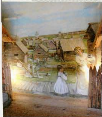
Дыярама-рэканструкцыя гарадской забудовы XIII стагоддзя