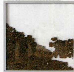
Збожжа, знойдзенае падчас раскопак. Датуецца XIII стагоддзем