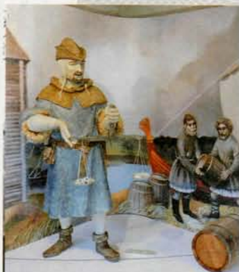
Выява заморскага гандляра, які прывёз на продаж дэфіцытны тавар – соль