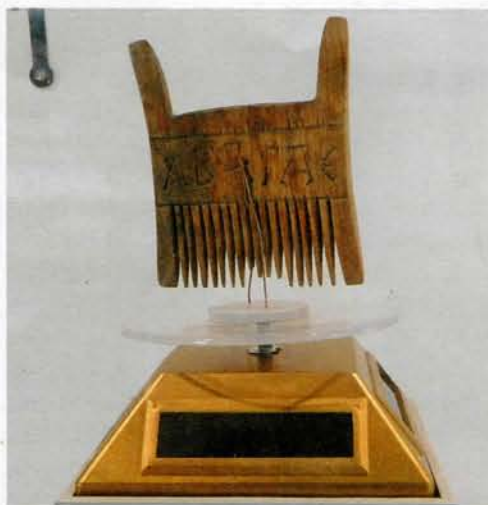
◀ Самшытавы грэбень з літарамі кірылічнага алфавіта (муляж)

А яшчэ на памяці П. Лысенкі і такі цікавы эпізод: у час раскопак асабіста яму трапілася ярка-чырвоная і сакавітая на выгляд журавіна, якая без доступу паветра праяждала ў зямлі некалькі стагоддзяў. Але зберагчы яе першаадкрывальнік Бярэсця не змог, бо як толькі ён усвядоміў, што перад ім яшчэ адна ўнікальная знаходка, ягада зморшчылася і імгненна пачарнела. Дарэчы, сярод знойдзеных археолагамі гістарычных рэліквій значыцца і збожжа, як мяркуецца, гэта – зярняты жыта. Вось толькі ў адрозненне ад падобнай сітуацыі, згаданай беларускім класікам Максімам Багдановічам у вершы «Санет», калі «паміж пяскоў Егіпецкай зямлі» даследчыкі старажытнасці «ў гаршчку насення жменю там знайшлі», «жыццёвая... сіла» ўзятых на дослед некалькіх засохлых берасцейскіх зярнят не абудзілася і не здолела ўскаласіць «парой вясенняй збожжа на раллі».