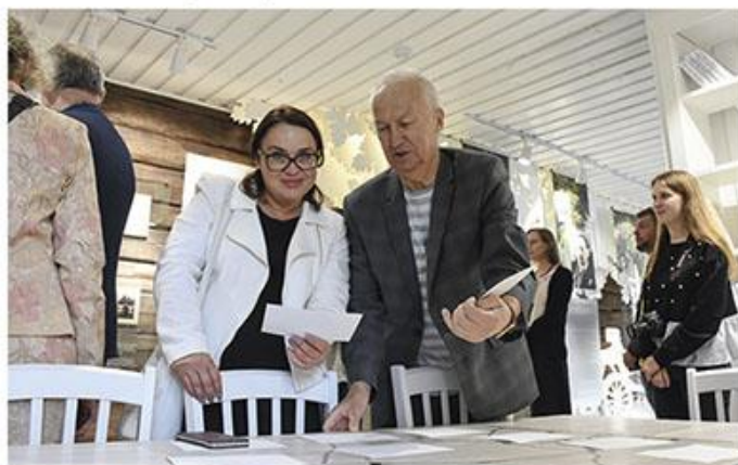
Сам сабе экскурсавод.