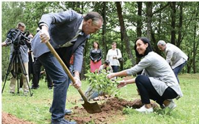
Пасадка бэзу “Паўлінка”.