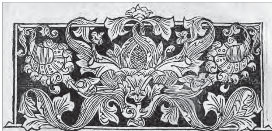
Застаўка. Трыёдзь (1589).